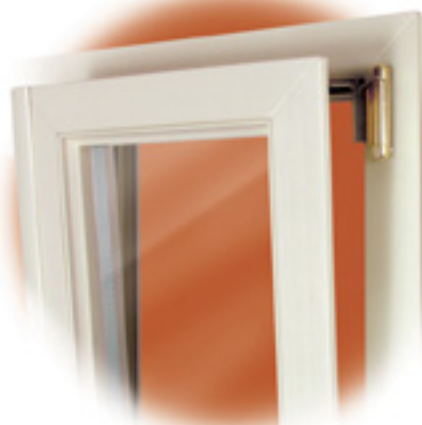
Movimentazione per Anta e Ribalta