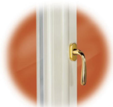
Maniglia in ottone, finitura oro lucido, dal design sobrio ed elegante.