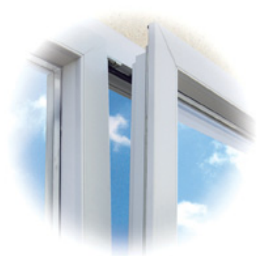
Movimentazione per Anta e Ribalta

L'essenzialità, la bellezza e la funzione