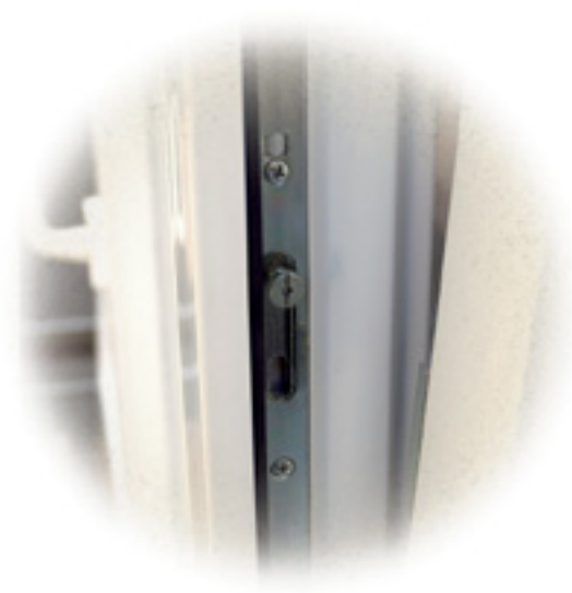
Meccanismo di chiusura.